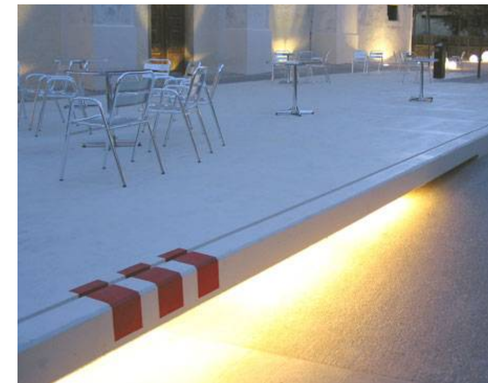
Betonrahmen, Fußgängerzone Innichen