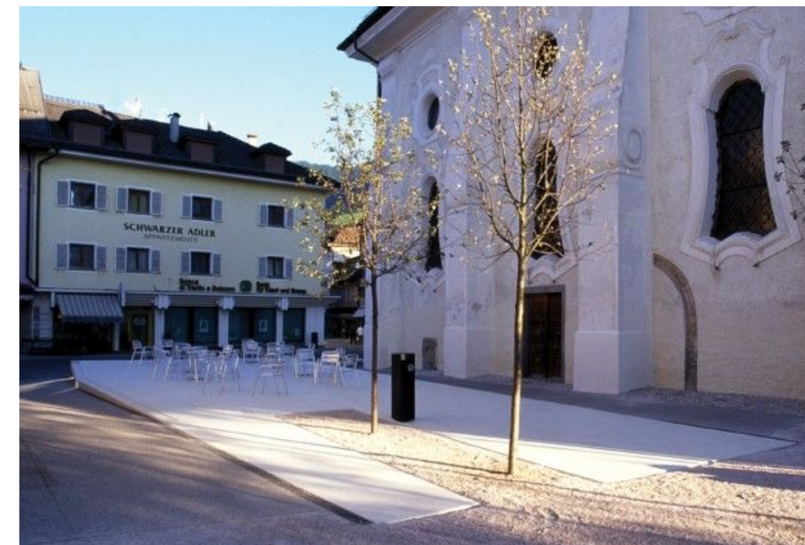
Betonrahmen, Fußgängerzone Innichen