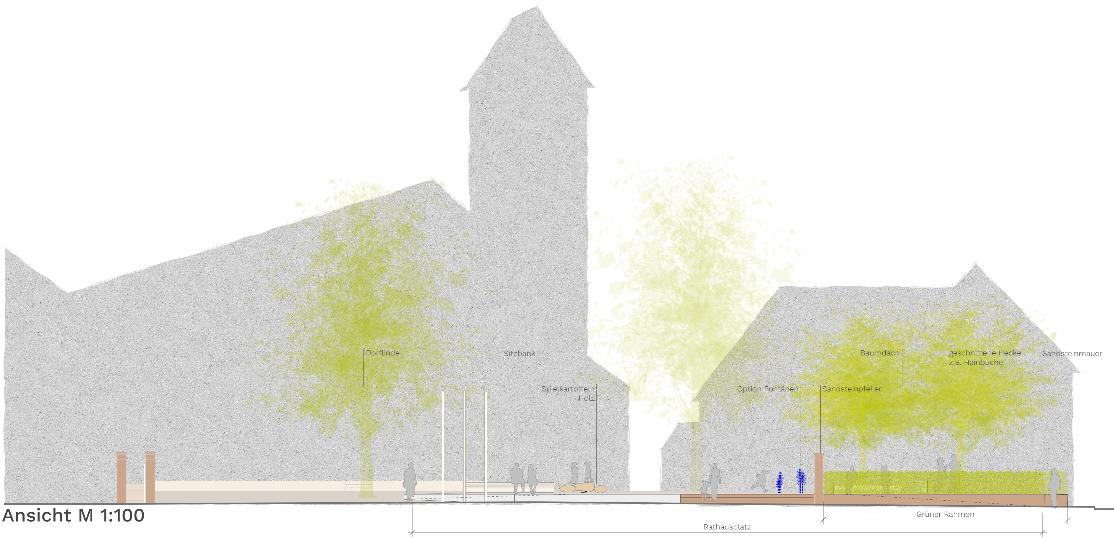
Ansicht M 1:100

Zwei Linden sorgen neben dem Baumdach für zusätzlichen Schatten auf und um den Platz.