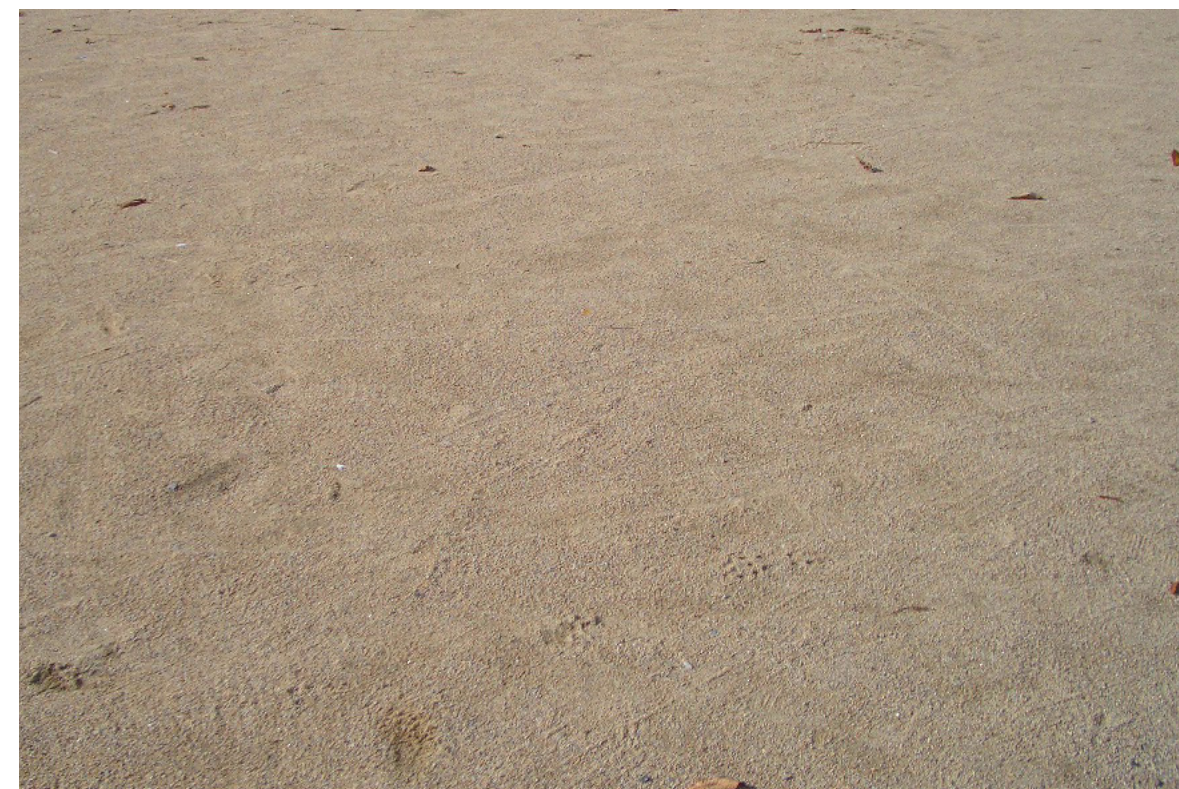
Kiesbelag Wassergebundene Wegedecke