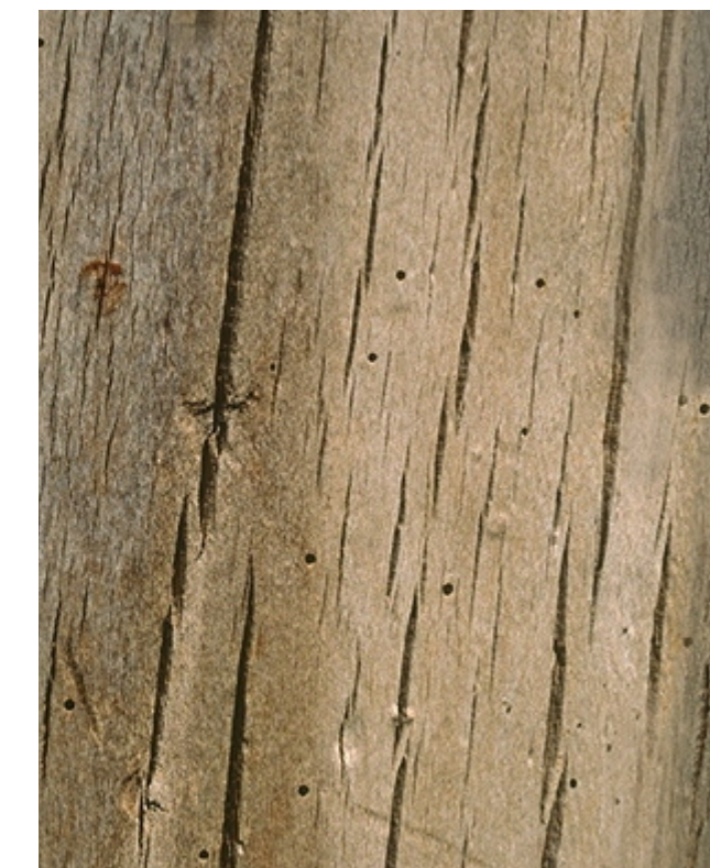
Holz für Ausstattungselemente