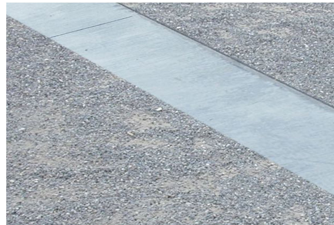
Betonband als Platzeinfassung