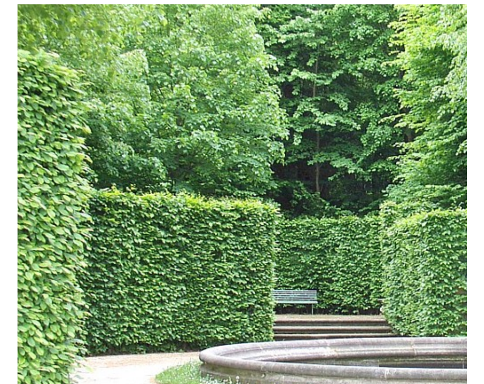
Boskett, mit Hecken gerahmter Platz